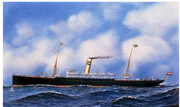
De ss 'Statendam' (1898-1910)